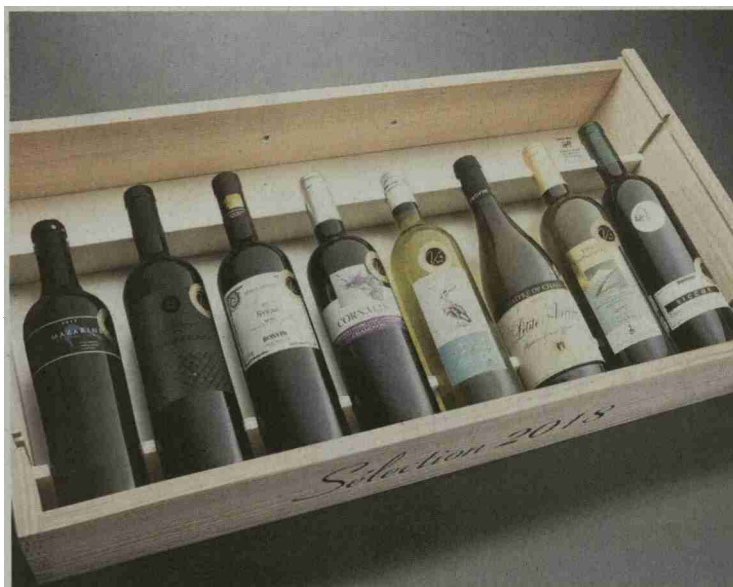
Sichere Werte: acht Preziosen von ausgezeichneten Kelterbetrieben.

Referenz: 72140823 Ausschnitt Seite: 1/1