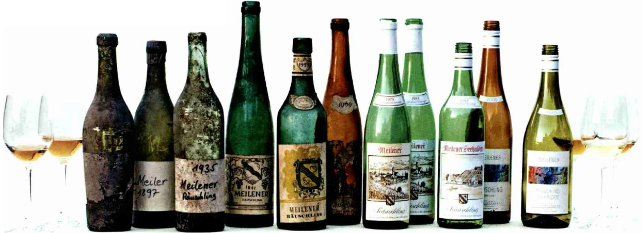
Flaschenparade 1895 bis 2007

Themen-Nr.: 721.003 Abo-Nr.: 721003 Seite: 30 Fläche: 97'415 mm 2