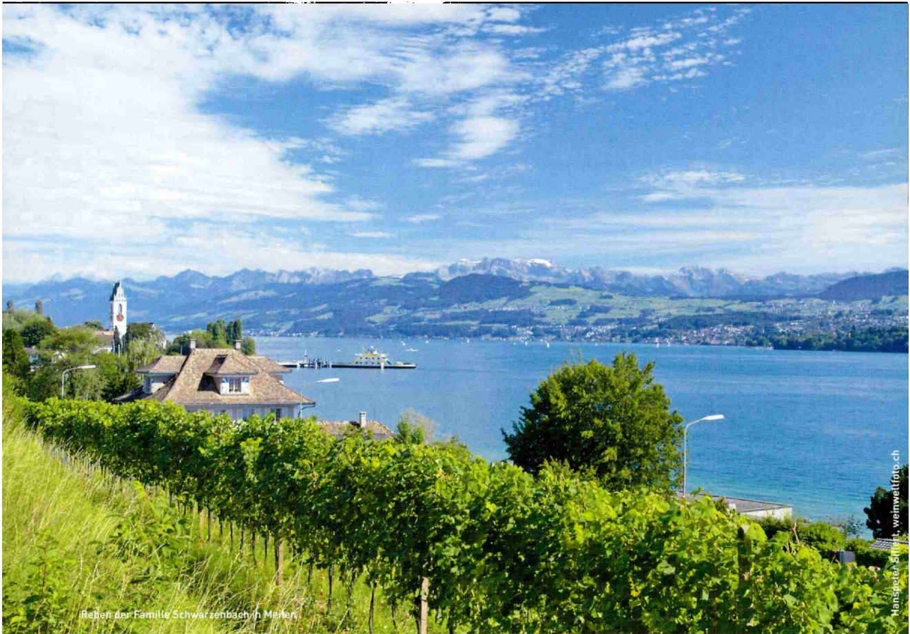
Reben der Familie Schwarzenbach in Mellen

Themen-Nr.: 721.003 Abo-Nr.: 721003 Seite: 60 Fläche: 144'031 mm 2