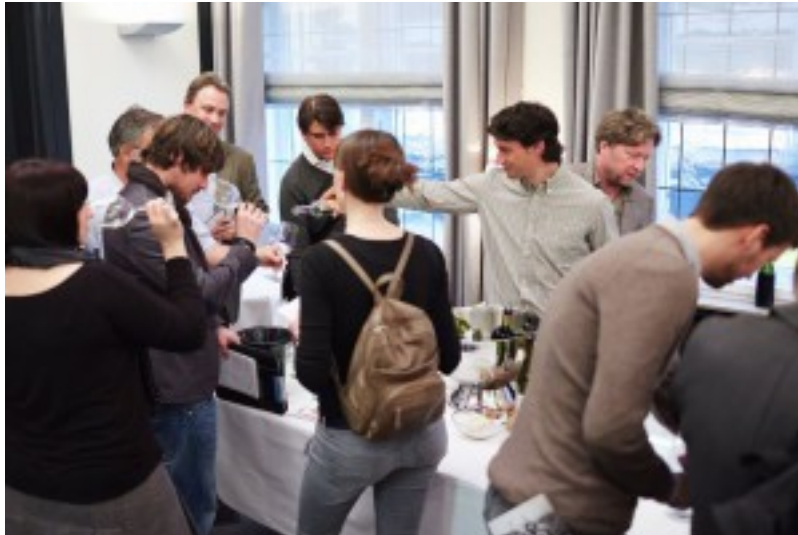
Der Jahrgang 2004 an der Raritätenprobe des MDVS