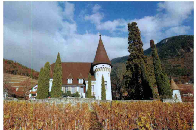
Château Maison Blanche, Yvorne, une des membres les plus nobles de l'association Clos, Domaines & Châteaux.

Une bonne occasion de rappeler ici que Clos, Domaines & Châteaux est la marque distinctive de quelques-uns des plus beaux domaines viticoles du pays, associés afin de